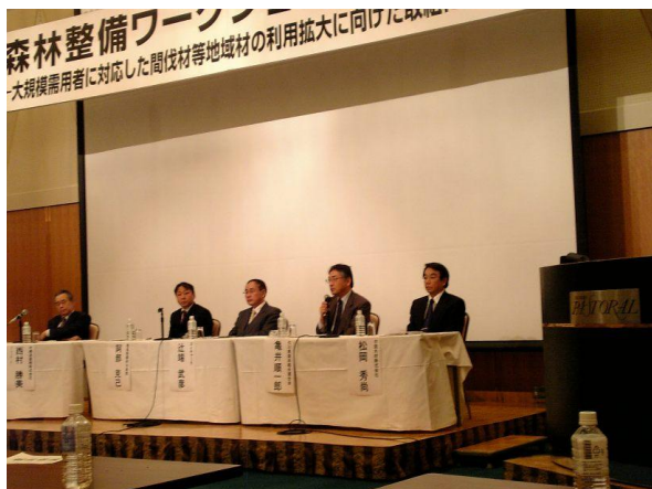
森林整備ワークショップ