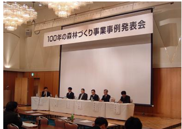
100年の森林づくり事業事例発表会