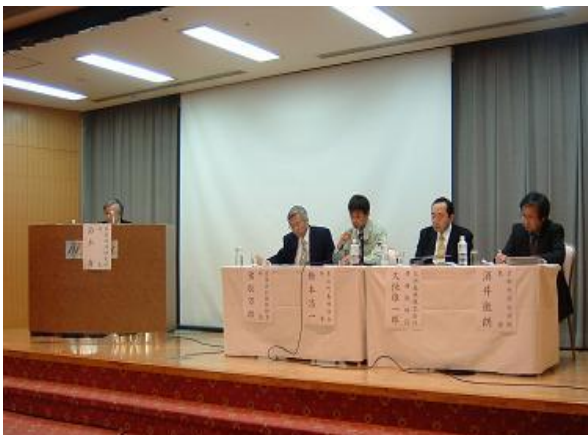
革新的施業技術等取組事例発表会

昨年度より始まった施業集約化・供給情報集積事業の一環として実施した森林施業プランナー育成研修(全35回)を修了した組合の中から、提案型集約化施業の普及・定着に役立つと考えられる取組事例について、プレゼンテーションおよびポスターセッションの形式で発表を行う。